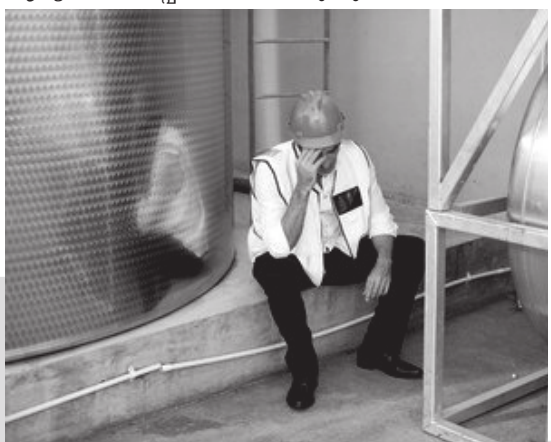
12 2019 നവംബർ

ഇതാണ് ഹേതുവിപരീതചികിത്സയുടെ ഏറ്റവും മികച്ച വർണ്ണനം എന്നു പറയാം. രോഗാരംഭത്തിൽ തന്നെ ചികിത്സിക്കുമ്പോൾ ഹേതുവിപരീത ചികിത്സയാണ് ഏറ്റവും ശരിയായ ചികിത്സ. അതു ചെയ്താൽ രോഗം ആശു-പെട്ടെന്ന്-ശമിക്കുന്നു എന്നാണിവിടെ രേഖപ്പെടുത്തി വെച്ചിരിക്കുന്നത്. ഇതു ചെയ്യാതെ വ്യാധിവിപരീതമോ തദർത്ഥകാരിയോ ആയ ചികിത്സകൾക്ക് മുതിരുന്നത് ഈ കൃത്യത നഷ്ടപ്പെടാൻ ഇടയാക്കുന്നു. അത്തരം ചികിത്സ