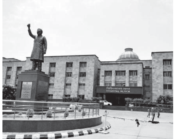
ചൗധരി ബ്രഹ്മപ്രകാശ് ആയുർവേദ ചരക് സംസ്ഥാൻ, ന്യൂഡെൽഹി

ഒരു സംയോജിത മെഡിക്കൽ ബോർഡി (Integrated Medical Board) ന്റെ മേൽനോട്ടത്തിൽ അന്തിമഫലം നിഷ്പക്ഷമായി വിശകലനം ചെയ്ത് പ്രസിദ്ധപ്പെടുത്തുകയും വേണം. ഇങ്ങനെ ചെയ്താൽ ഇക്കാര്യത്തിൽ ലോകത്തിനു മുഴുവൻ തെളിവു നൽകാനും പുതിയൊരു